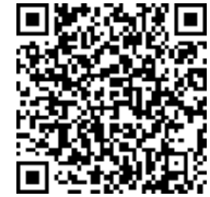
応募用 QR コード