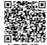
応募用 QR コード