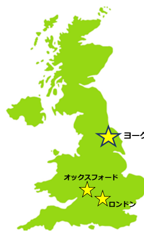
ヨーク大学キャンパス