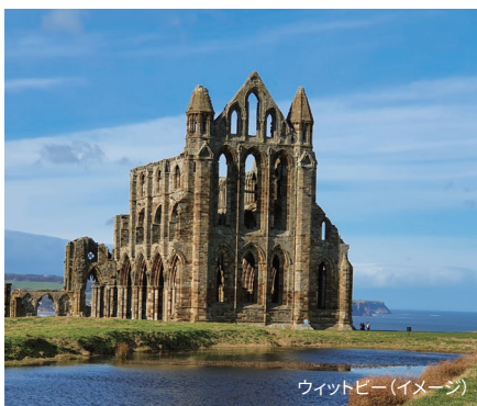
ワイトビー(イメージ)