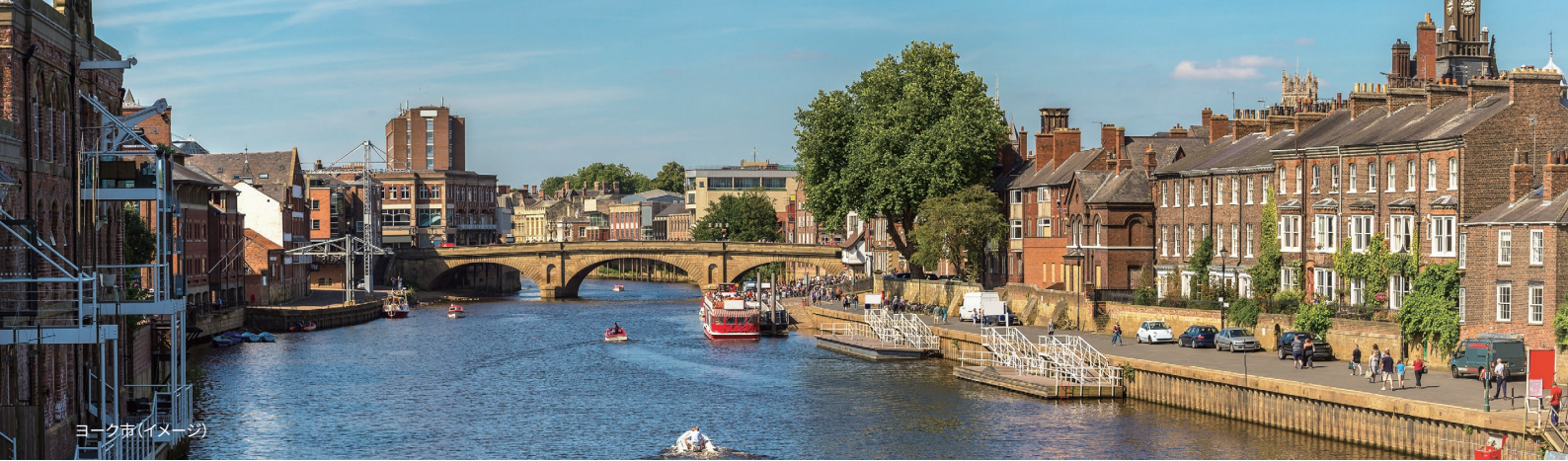
ヨーク市(イメージ)