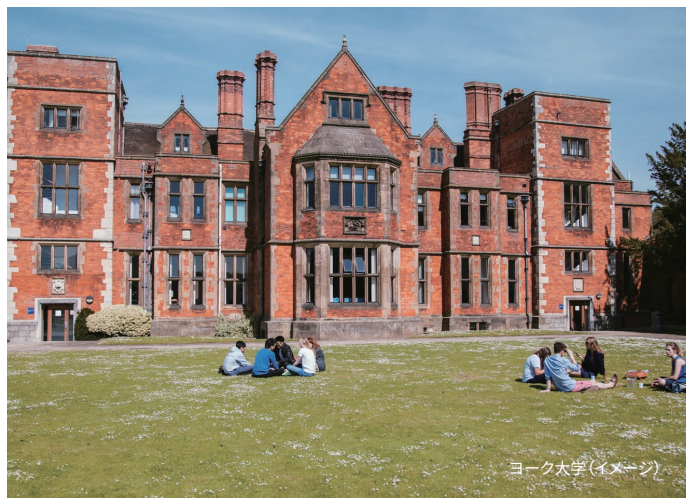
ヨーク大学(イメージ)