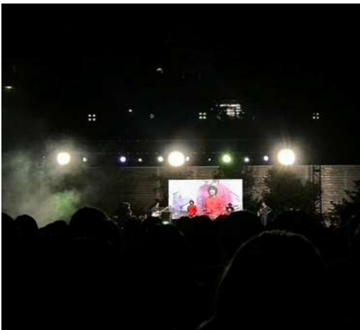
学祭のアーティスト公演