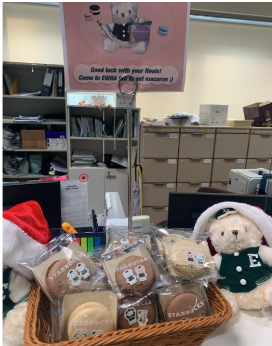
期末試験前オフィスにてマカロンのプレゼント