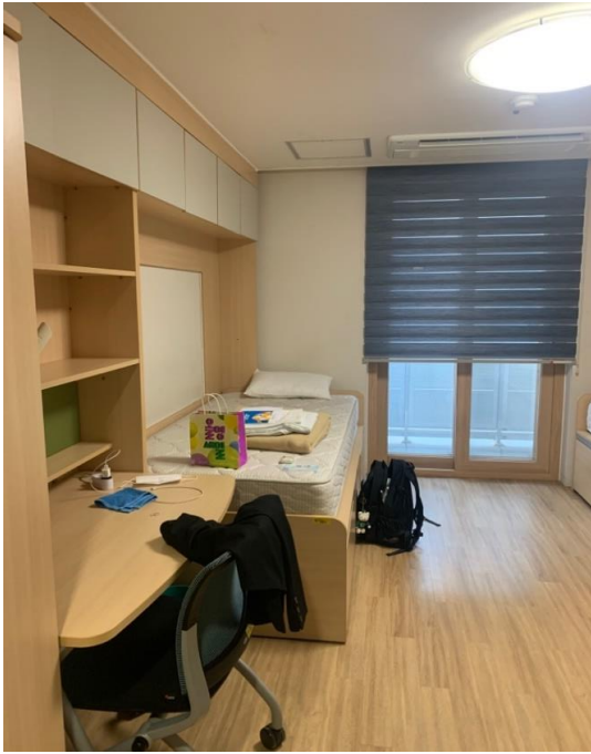
I-HOUSE D棟の自室(引っ越し日)