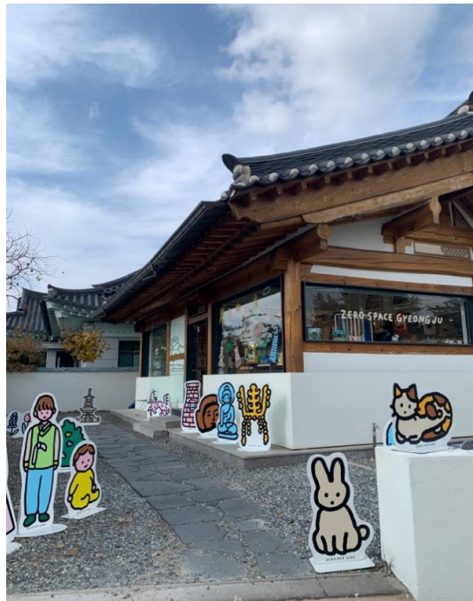
個性的で可愛い雑貨屋さん