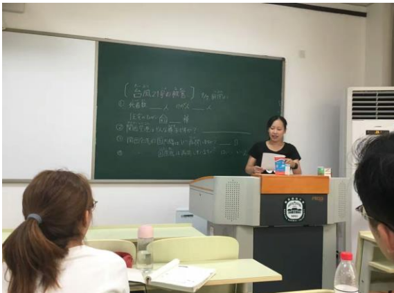
↑日本語ボランティアでリスニングの練習をしています。中国人の学生約10人に日本語を教えていました。