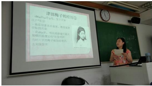
↑総合のプレゼンテーションで津田梅子さんを紹介しました