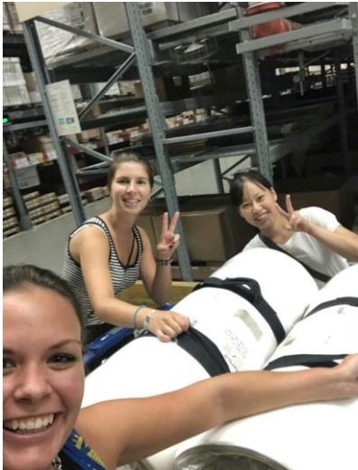
←ドイツ人ルームメイトが南京に来たばかりの頃、生活用品の買い物をお手伝いしました。(IKEAにて。)