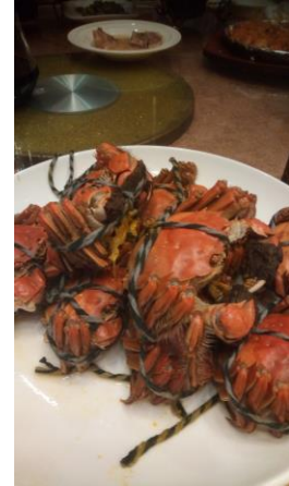
↑上海蟹 旬の季節に食べました。