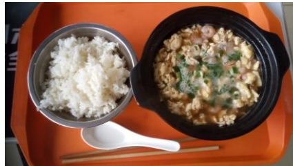
↑食堂のご飯 沢山のメニューがあります。