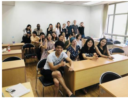
←クラスメイトと記念撮影