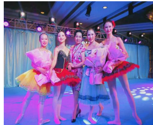
↑秋にバレエ学校の公演に参加しました。バレエ学校の皆さんと一緒にリハーサルをして本番の舞台に立ちました。同じ趣味を共有する仲間として、皆さん優しくして下さい嬉しかったです。