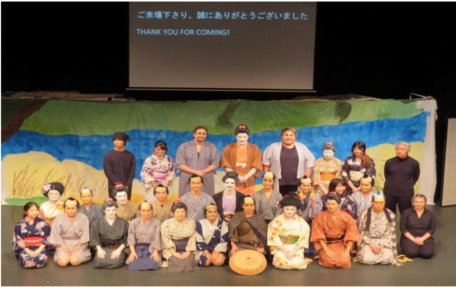
歌舞伎の公演(前列左から5番目)