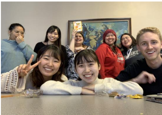
←日本語授業を履修中の生徒さんと (日本語ミーティング)