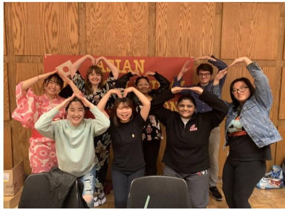
East Asian Night にて (右:ファッションショーの格好にて 左:クラブメンバーと)