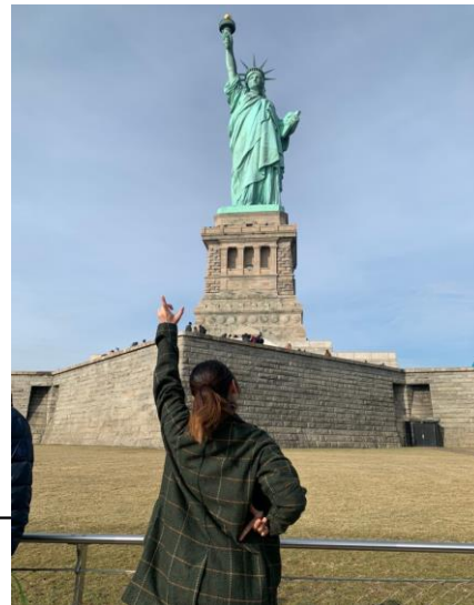
冬休み中のニューヨーク旅行